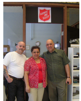
L'équipe de l'Armée du Salut

loin, permettent aux adolescents de réparer leurs torts dans la communauté.